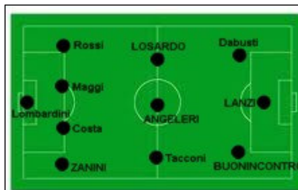
I nuovi 11 titolari dell’A.C. Castelletto, ipotizzati dalla redazione de “L’Alcooligano”...